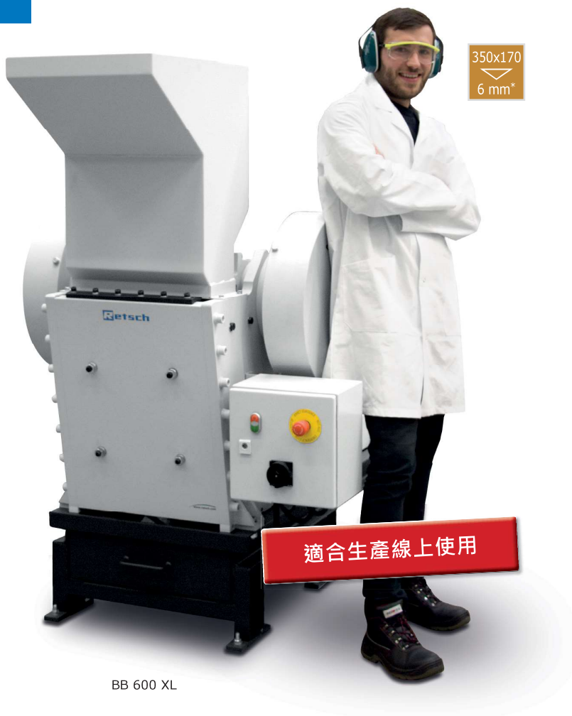
BB 600 XL