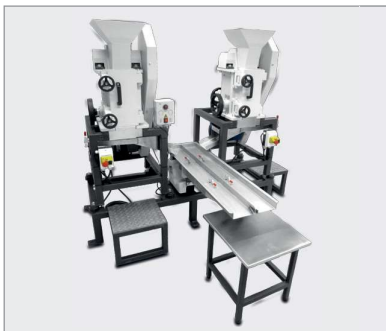
訂製機種： BB250XL兩台加上樣品自動分樣裝置設計