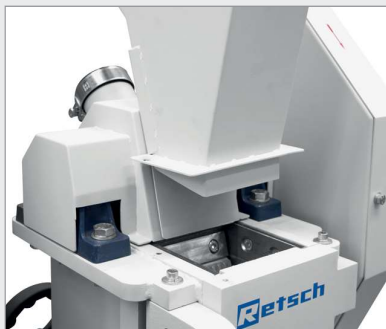
BB 250 XL 和 BB 400 XL: 可拆卸式入料斗