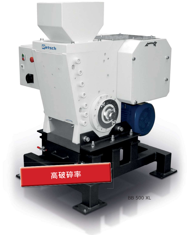
BB 500 XL

一旦樣品被處理到小於間隙尺寸，就會掉落至樣品回收槽。間隙設定為連續式調整，大幅提高了出料細度的控制。