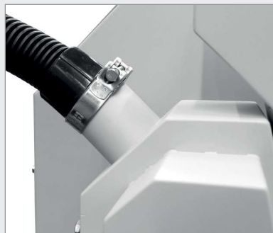
BB 250 XL 和 BB 400 XL: 吸塵器接口