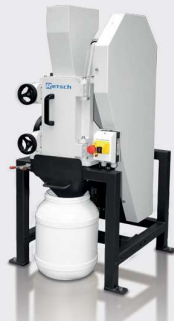
BB 250 XL選配 附出口收集配件+ 30L收集桶