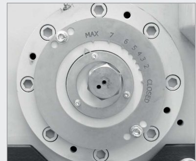
BB 500 XL: 連續式間隙調整