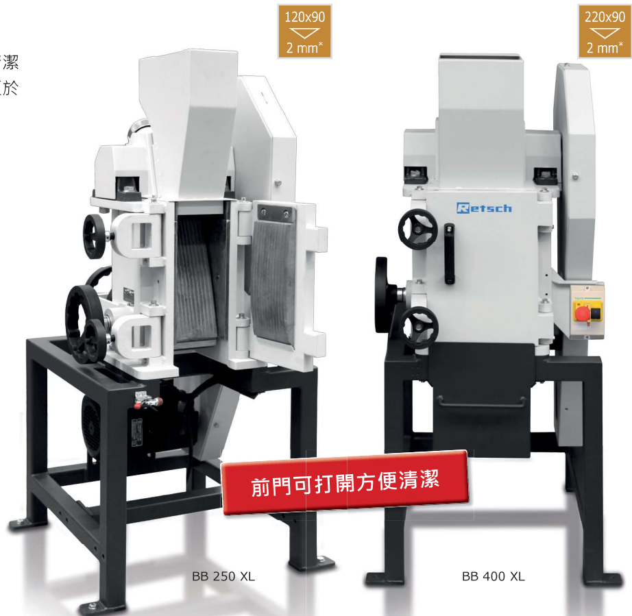
BB 250 XL